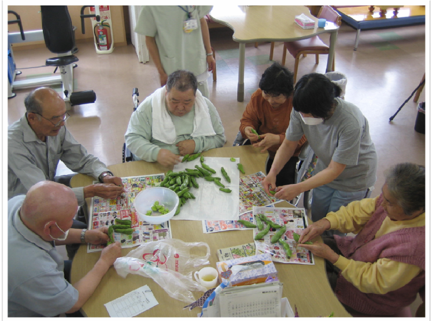
★デイルームへ持って帰って皮を剥いています