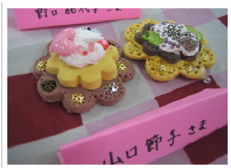
★ネームプレートも作りました