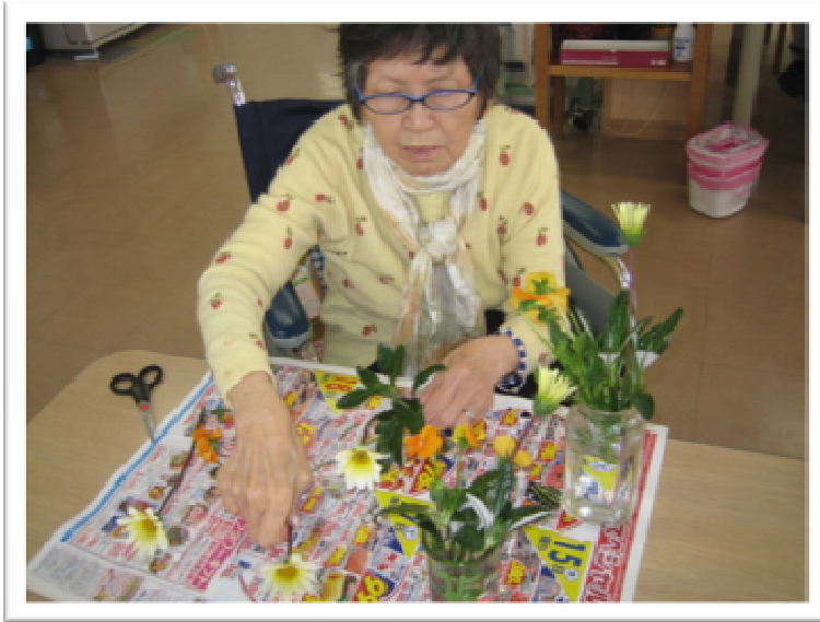
★花壇の花を採ってきて、花瓶にさしています