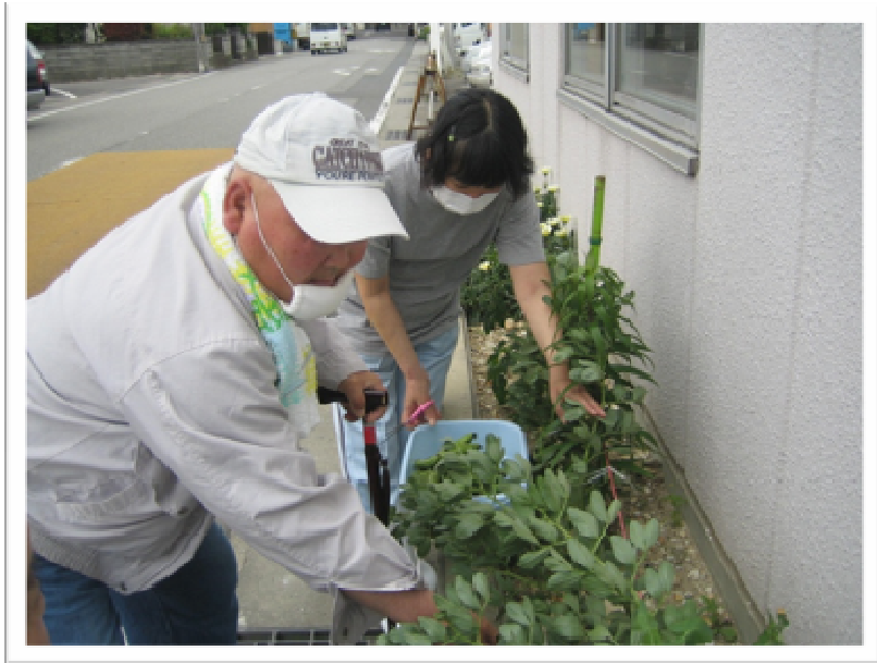
★頑張って豆をちぎっています