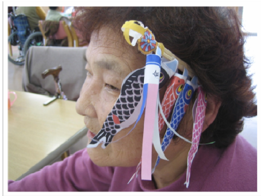
★頭にさしちゃいました！