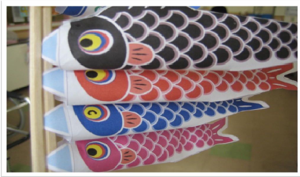
★上手にできました