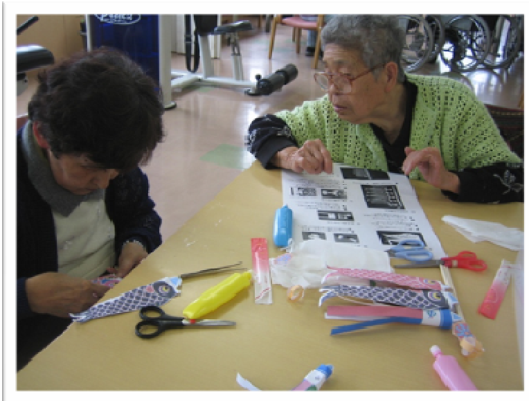
★こいのぼりづくり

また、華の都の花壇に空豆ができたので、みんなで収穫し、その日に塩ゆでにして食べました。中身がしっかり詰まっていて美味しかったそうです。夏に向けて、現在はひまわりを植えています。今月の写真はこちらですー☆彡↓