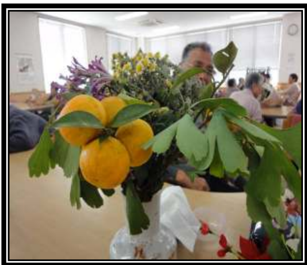
★すだちを持ってきてくれました