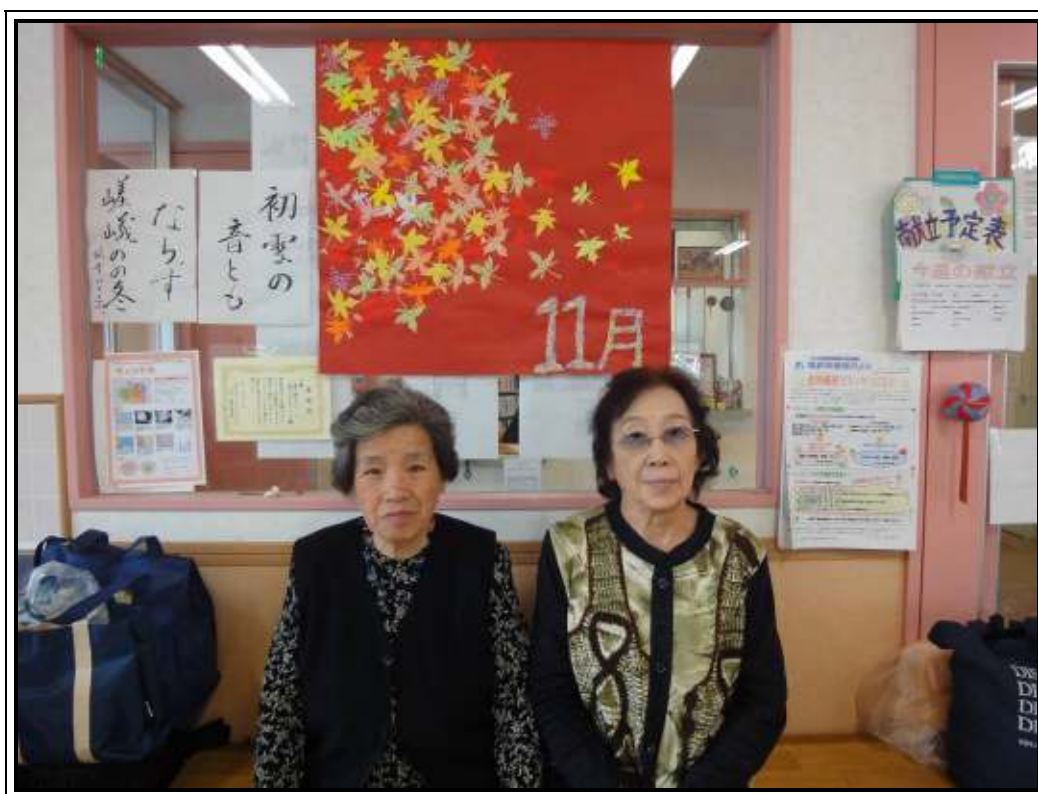
★みんなで力を合わせて1日で仕上げました