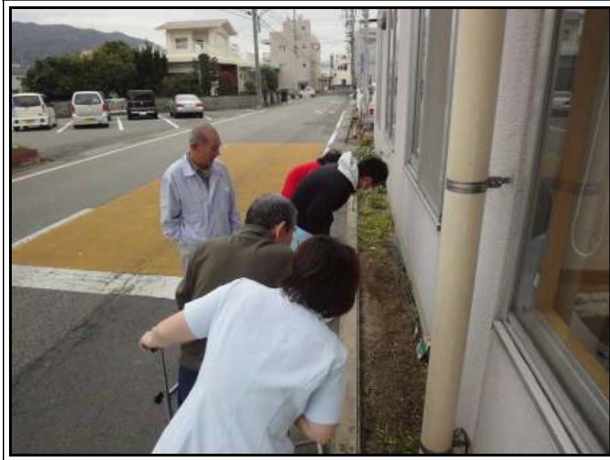
★みんなで野菜・花の成長を確認！！