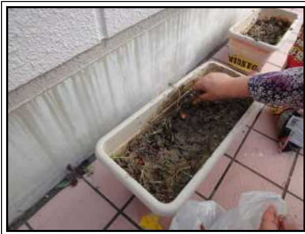
★花の種を植えています