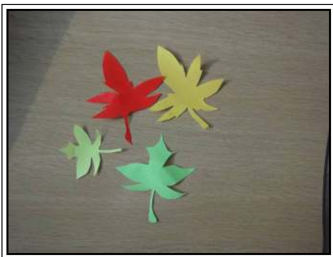
★色々な色や大きさに切ります