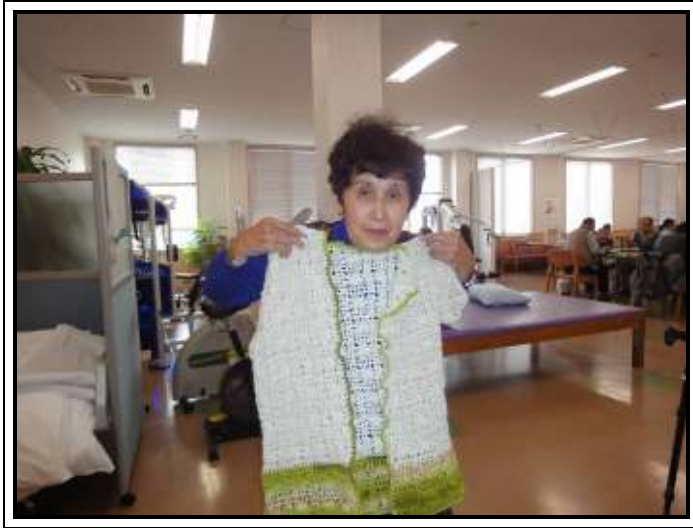
★手編みのカーディガン、完成です