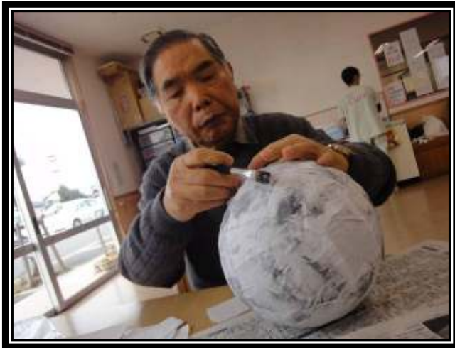
★新聞紙の上に重ねて半紙を貼ります