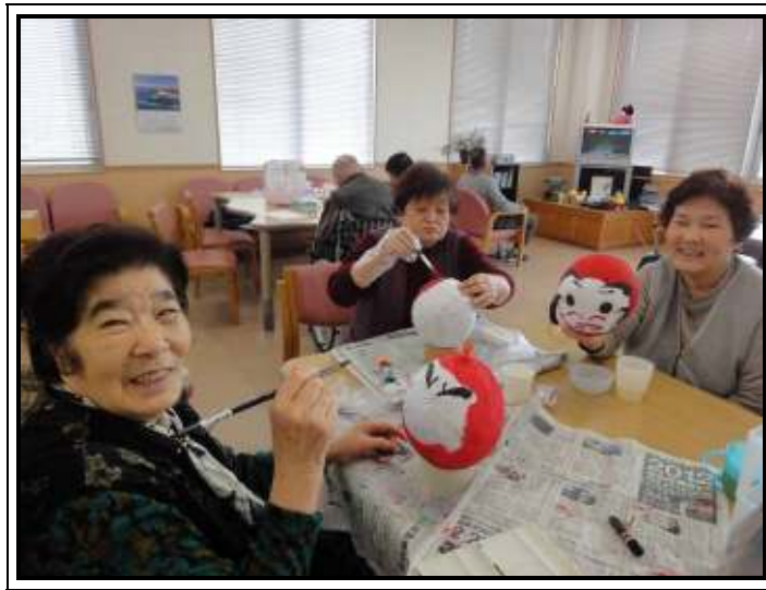
★ダルマに色を付けます！！