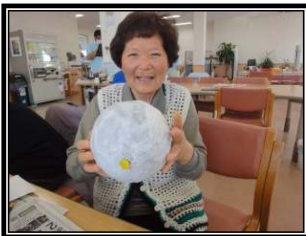
★きれいに貼れています♪