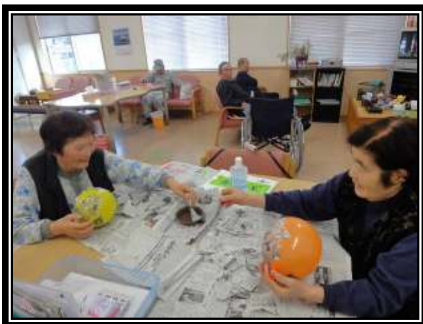
★風船に新聞紙を貼っていきます