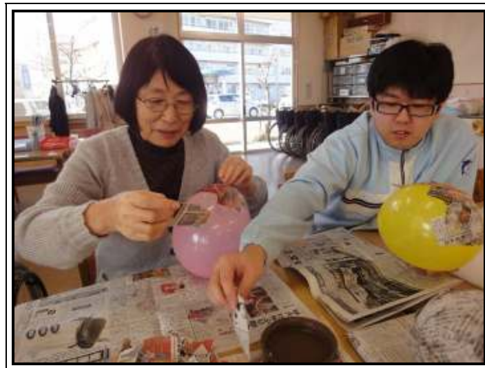
★ダルマ作りスタートです