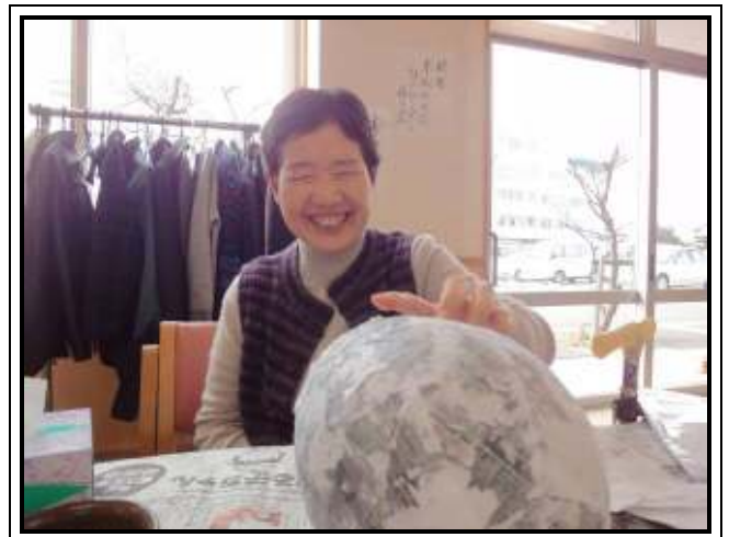
★コロコロ転がって大変！