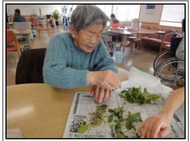
★ほうれん草の根っ子をとっています