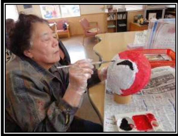
★ダルマの顔をいれていきます