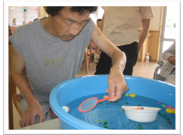
★午前中チャンピオン