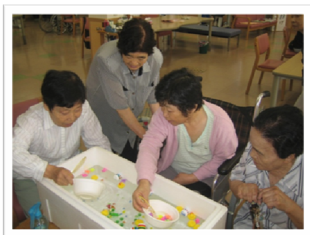
★一番人気の金魚すくい