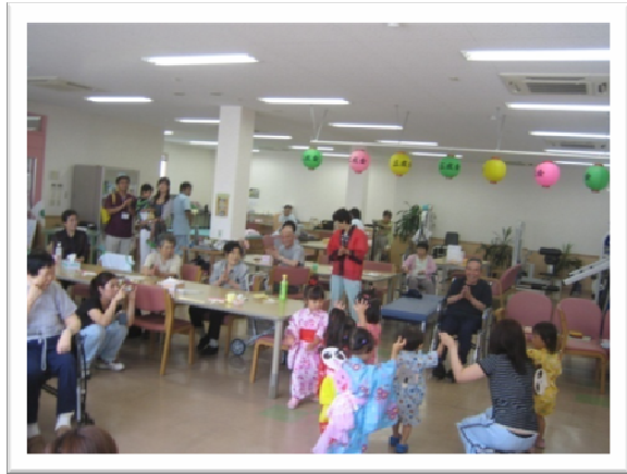
★阿波踊り、フロア全体が盛り上がりました