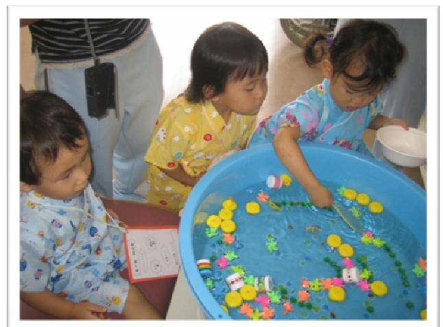
★子ども達も夢中です！