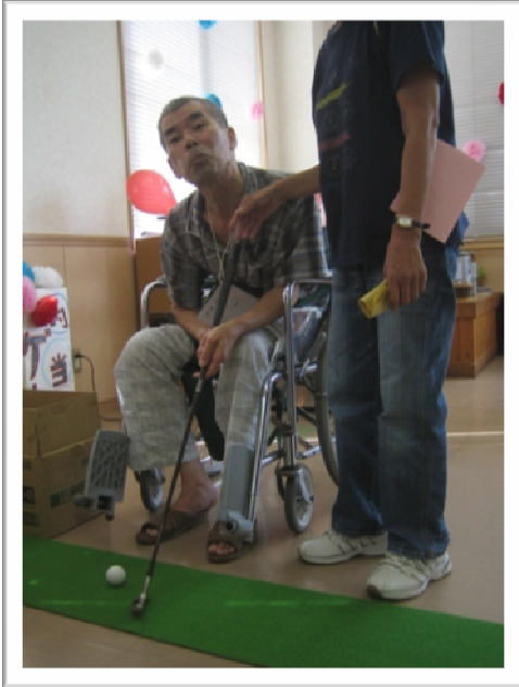
★入院患者様と家族の方