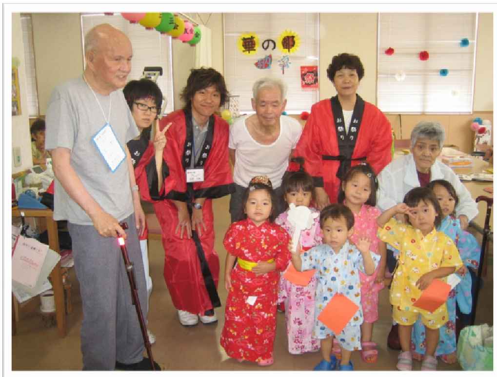
★いるかキッズと一緒に

平成 21 年 8 月 7 日に華の都にて納涼祭が開かれました。今回は例年のコンサートとは少し違っており、金魚すくい、的あて、パターゴルフ、輪投げなど各ゲームを一日かけて回って頂き、景品を獲得するというものです。また、いるかキッズが阿波踊りを披露してくれ、あまりの可愛さにアンコールがかかるほどでした。スタッフも初めての試みでしたが、利用者様をはじめ、入院患者様や家族の方、託児所の子どもさん達にも十分楽しんで頂けたと思います。その模様をご紹介します。