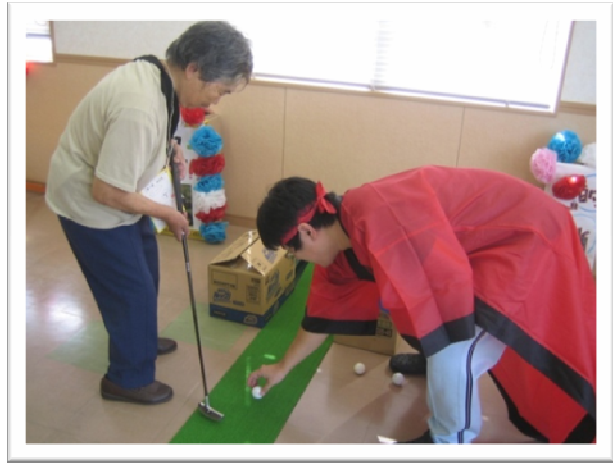
★パターゴルフはかなり難易度が高いようです