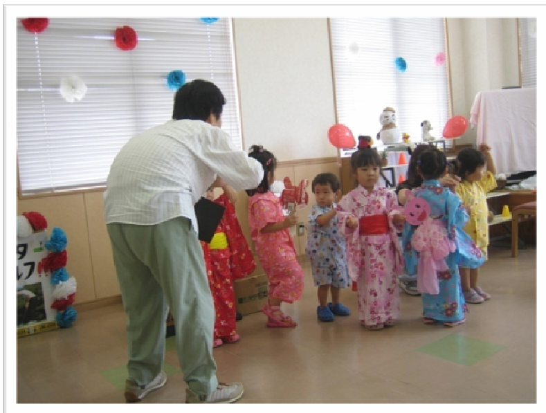
★みんな上手に踊れています