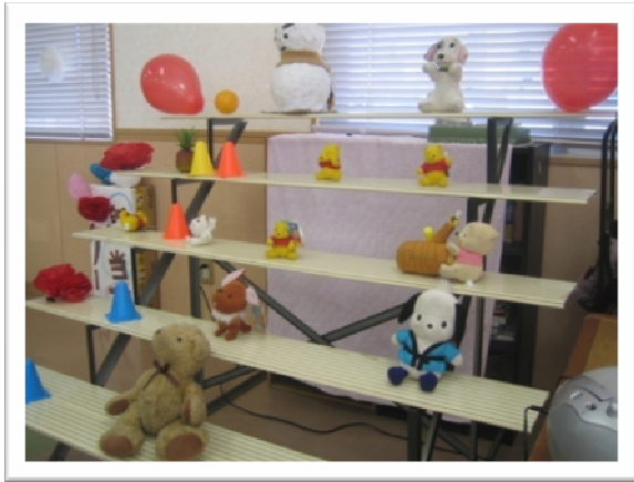
★空気鉄砲やボールでねらいましょう！