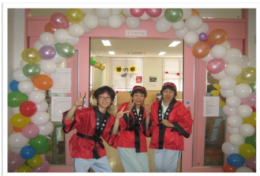
★通所三人娘も頑張りました！