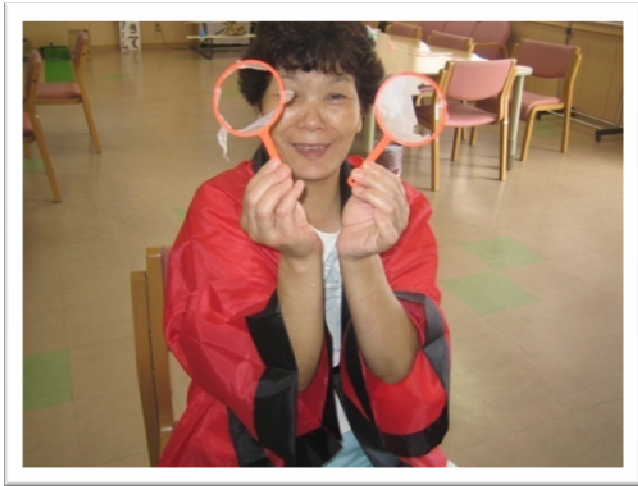
★職員チャンピオン