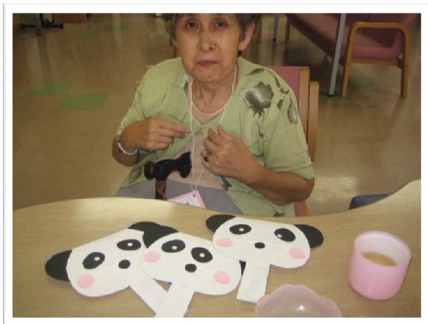
★いるかキッズが手づくりのうちわを作ってくれました