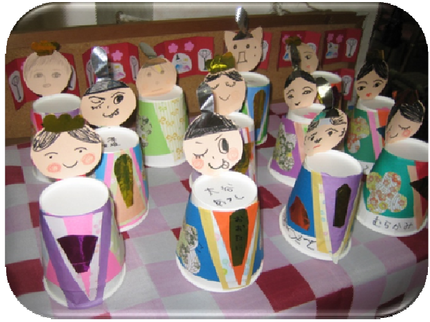
★今日のお昼はお寿司とひなまつりゼリーでした