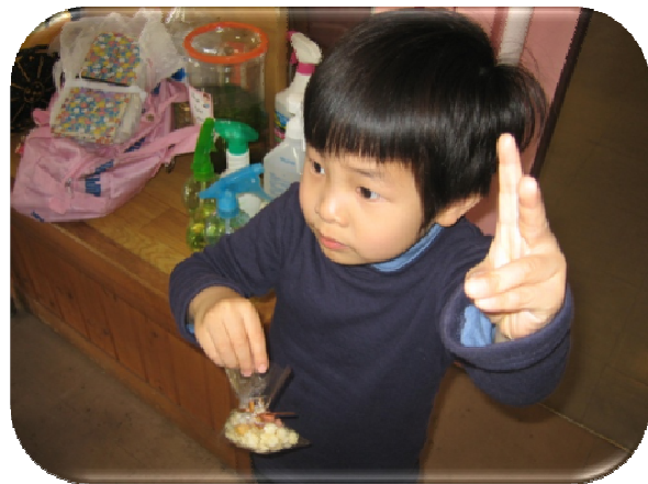
★いっぱい配るぞー！