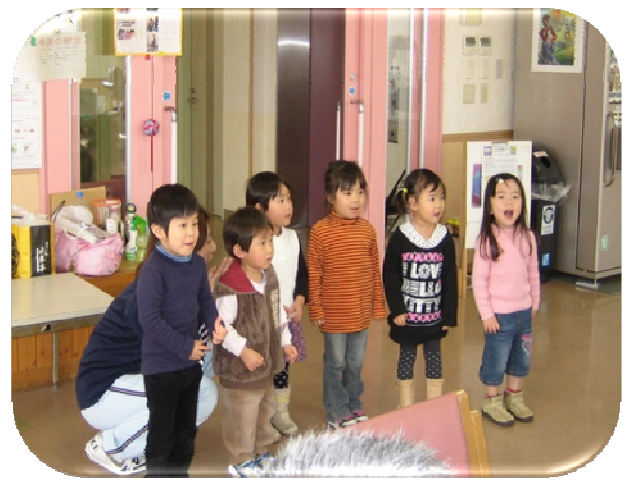
★あかりをつけましょ ぼんぼりに～♪