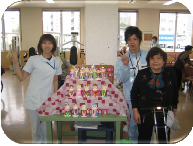
★ひなまつり大成功でした