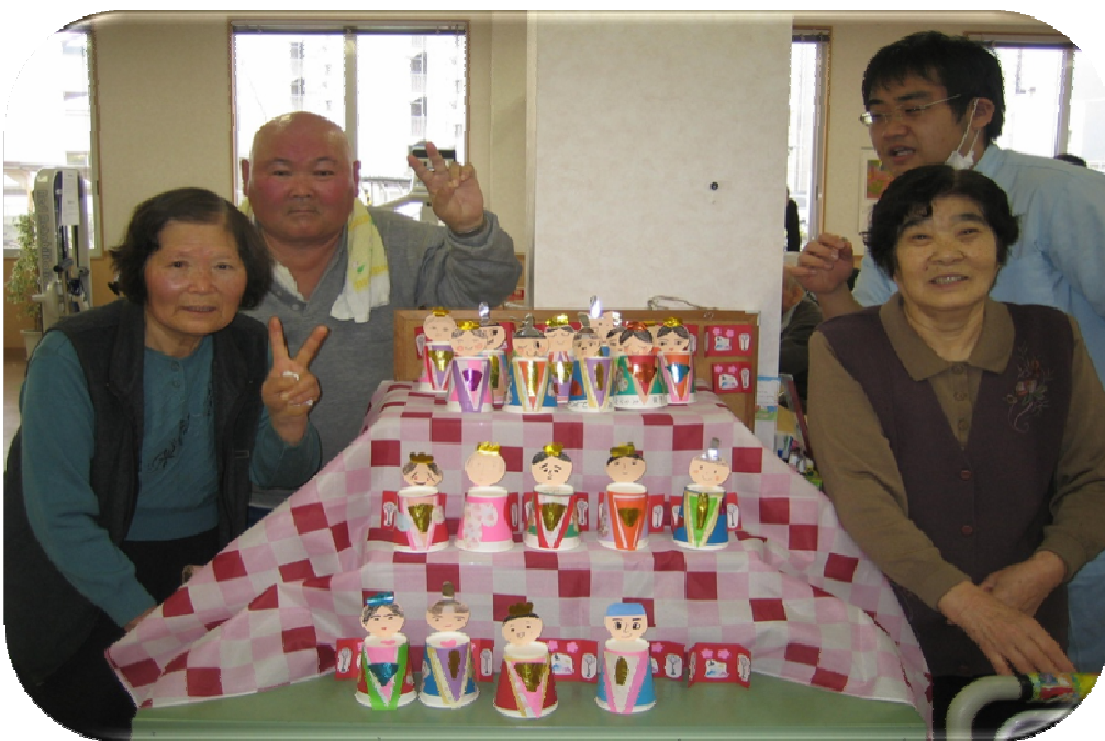
★並べると賑やかで綺麗ですね