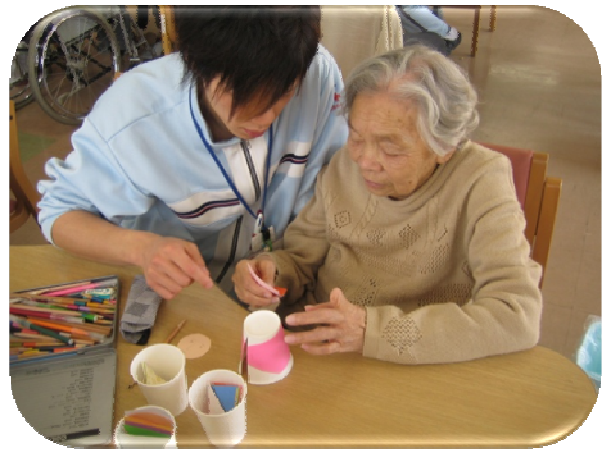
★どの色がきれいかな？