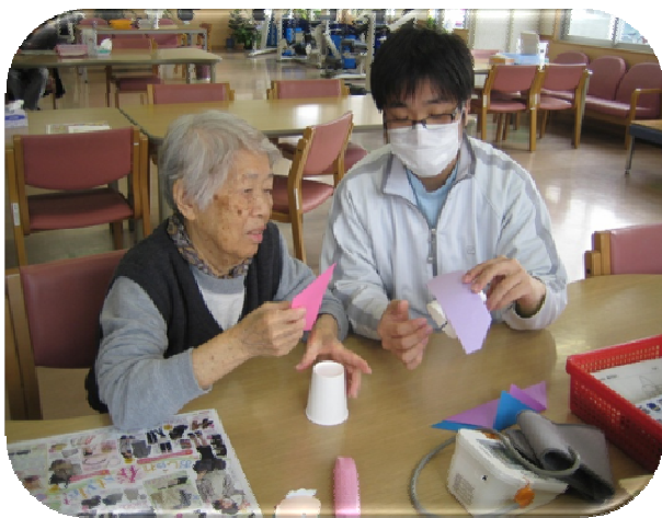
★入院患者様も一緒に