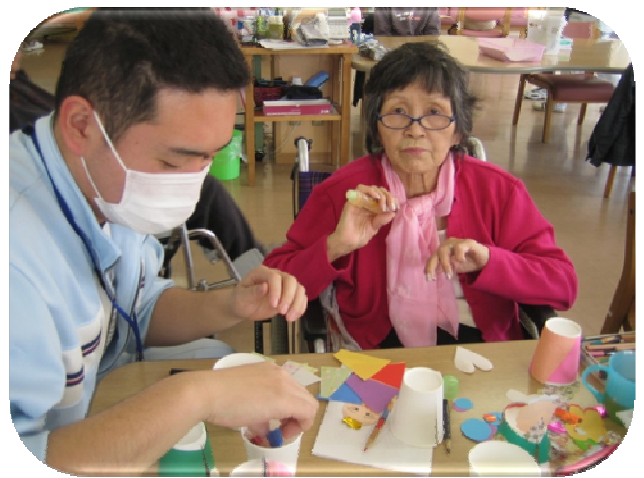
★手先がとっても器用！