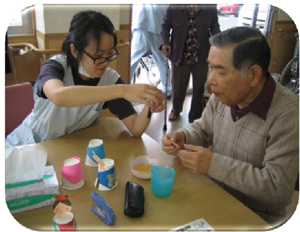
★うまくできるかな…