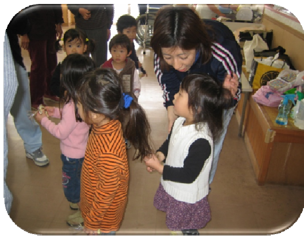
★大きな声で歌いましょう