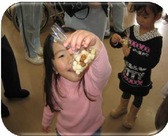
★ひなあられ、みんなで交換したよ