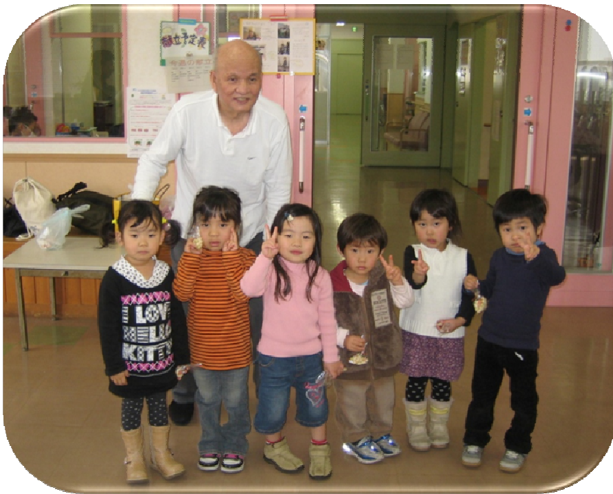
★いるかキッズと一緒に

また、いるかキッズが利用者様にひなあられと、ひなまつりの歌をプレゼントしてくれました。いるかキッズはいつも元気いっぱい利用者様から大人気です。その模様をご紹介します。