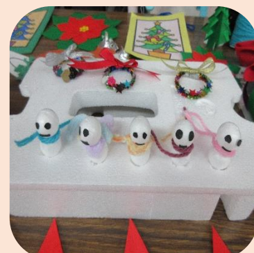
色んな作品が出来上が ってきています