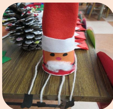
キュートなサンタさん