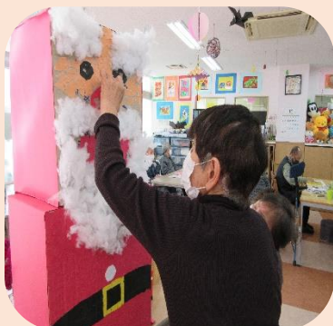
サンタさんの貼り絵

12月に病院にて、通所リハビリ作品展を開催する事が決まりました。 作品展に辺り、11月は作品作りが盛り上がりました。 12月に受診で病院に訪れる方は是非、通所リハビリ作品展をご覧ください。