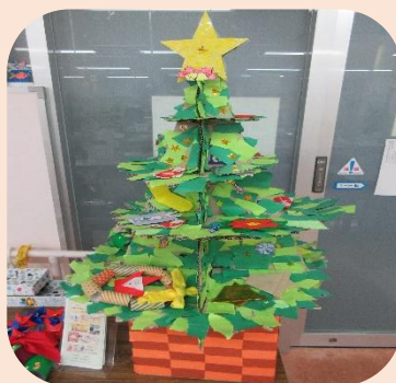
クリスマスツリー