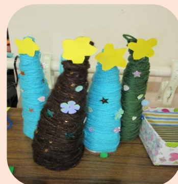
ミニクリスマスツリー