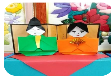
色んな種類の雛人形が出来ました