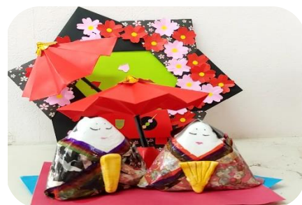
☆インスタ映え間違えなし☆