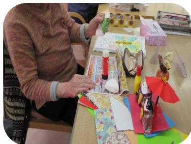
後は顔を描くのみ