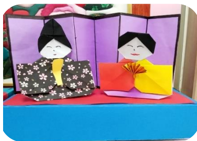
仲良さげで夫婦みたい