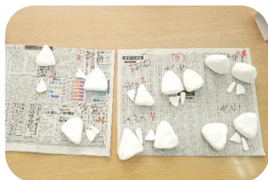
固まるまで一日固めます

3月3日のお雛様に合わせる為、2月中旬より紙粘土にてひな人形制作を開始しました。折り紙で作ったのと紙粘土で作った2種類で今回は作ってみました。