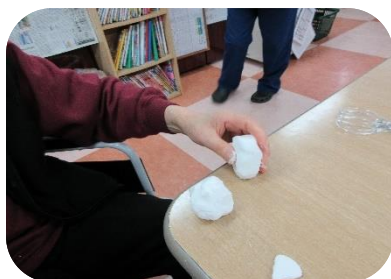
コツは三角おむすびを作ること