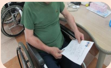
水戸黄門の歌を熱唱