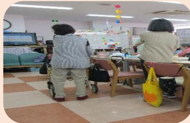
皆で元気よく体操