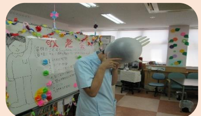
手袋を鼻息で割る芸