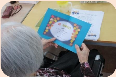
スタッフのコメントが