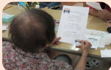
ああ人生に涙あり